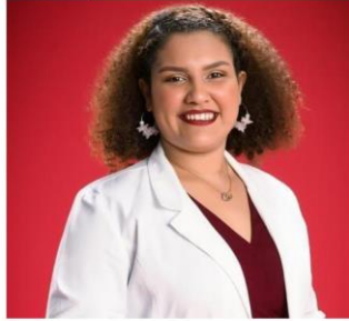
Cristel NG Futura Colega

A. C. T. U. A "El gremio eres tú, el gremio somos todos"